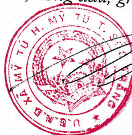
Trương Phước Sang